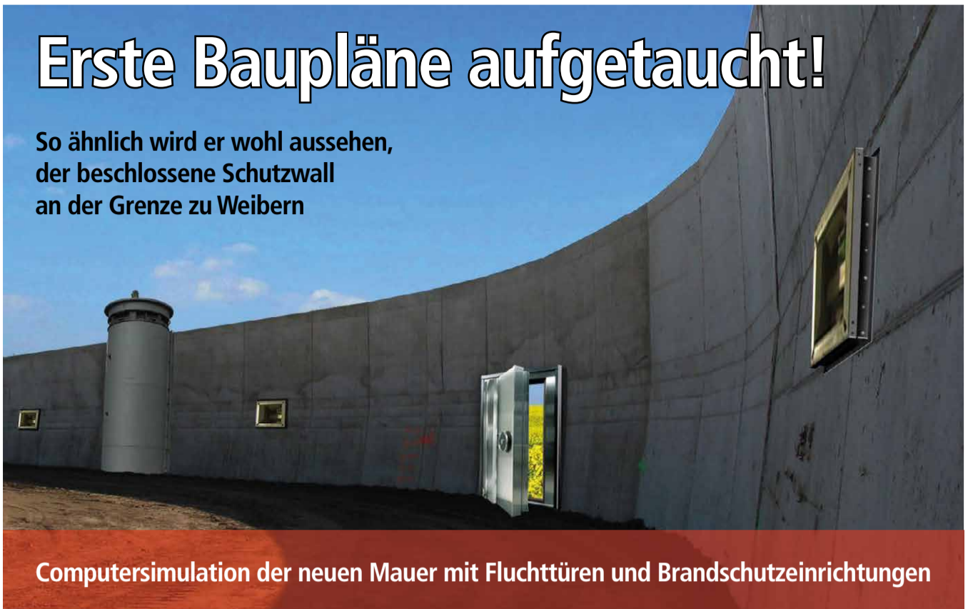
Computersimulation der neuen Mauer mit Fluchttüren und Brandschutzeinrichtungen

So ähnlich wird er wohl aussehen, der beschlossene Schutzwall an der Grenze zu Weibern